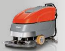
Scrubmaster B90 CL