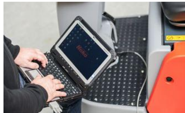
Einfacher Zugang zur Diagnose-Schnittstelle für Wartung und Modifikation von Fahreinstellungen.

Für mehr Flexibilität und Wirtschaftlichkeit bieten wir Ihnen attraktive Miet- und Leasingoptionen – optimal abgestimmt auf Ihren Bedarf.